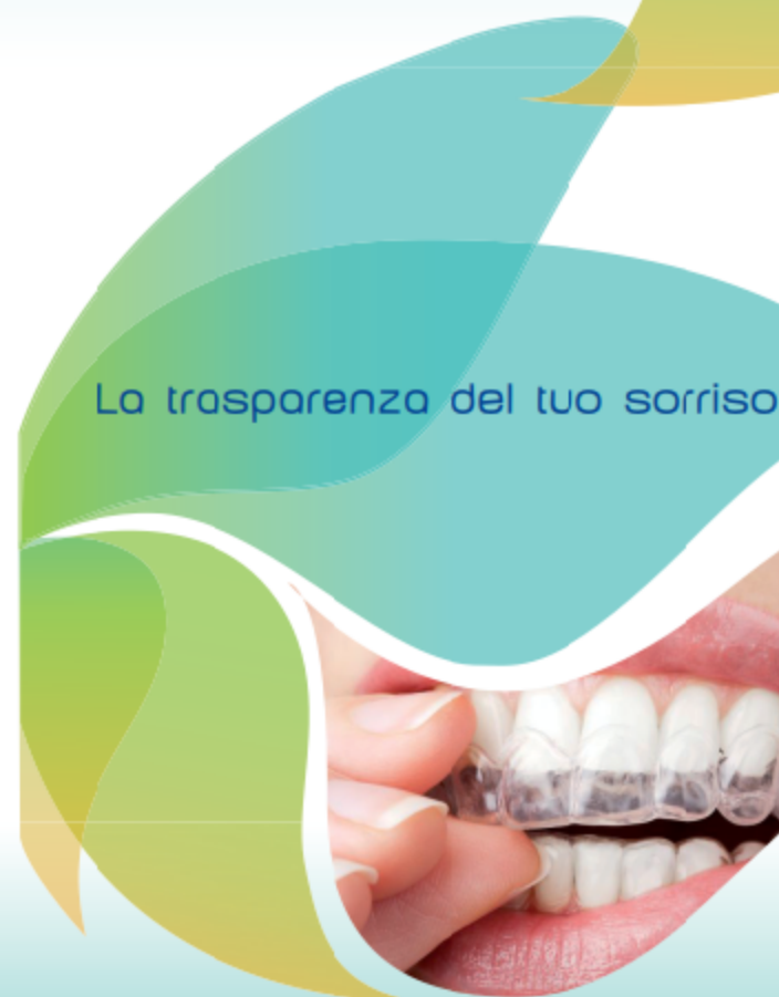
La trasparenza del tuo sorriso